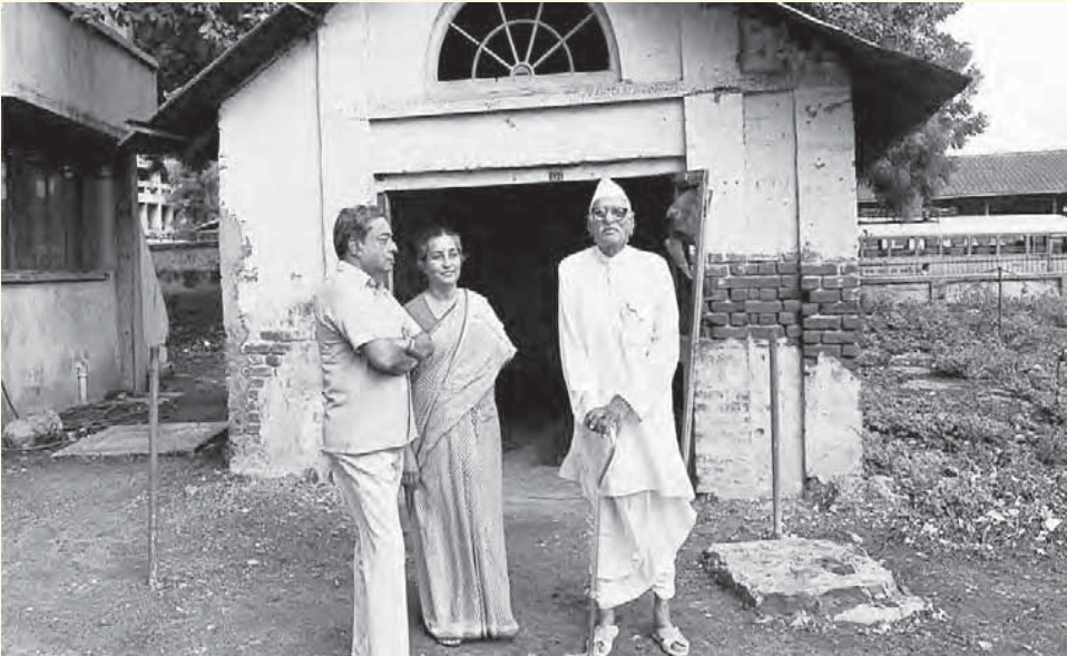
વર્ગીસ કુરિયન (ડાબે) અને ત્રિભુવનદાસ પટેલ (જમણે)

અમૂલની સ્થાપના 1946માં ત્રિભુવનદાસ પટેલ (વકીલ અને સ્વાતંત્ર્ય સેનાની) અને ડૉ. વર્ગીસ કુરિયન (મુંબઈમાં ડેરીની ફેક્ટરીમાં કામ કરતા એન્જિનિયર)ના નેતૃત્વ હેઠળ કરવામાં આવી હતી.