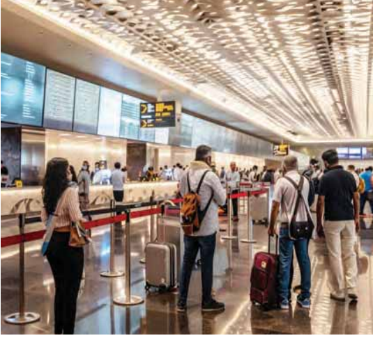
હવાઈમથકો પર સેવાઓ