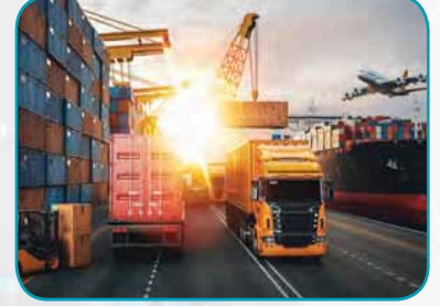
વેપાર અને માલવહન