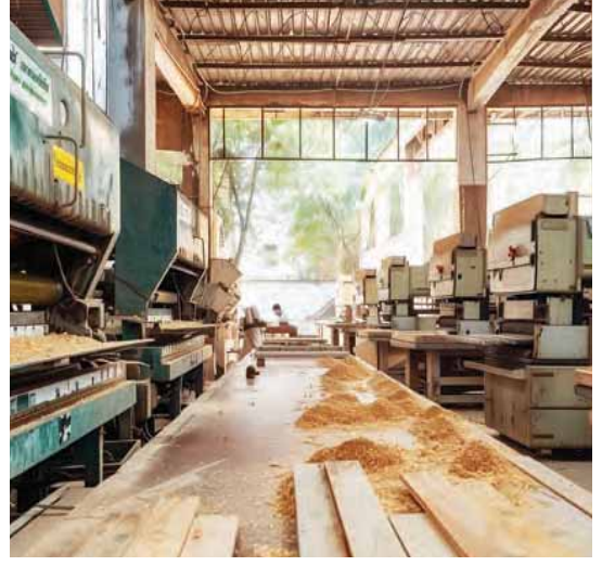
ફર્નિચર ઉત્પાદન એકમ