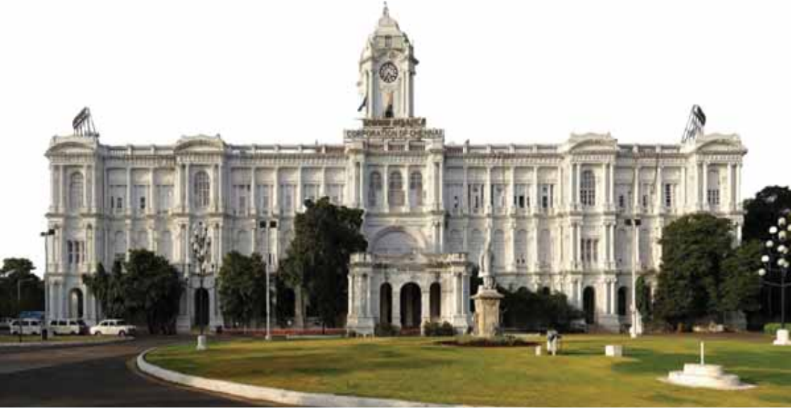
ચિત્ર 12.3 મદ્રાસ કોર્પોરેશન

મદ્રાસ કોર્પોરેશન (હવે બૃહદ્દેવેન્નાઈ કોર્પોરેશન)ની સ્થાપના 29 સપ્ટેમ્બર, 1688 ના રોજ થઈ હતી, જે ભારતની સૌથી જૂની મ્યુનિસિપલ સંસ્થા છે. ઇસ્ટ ઇન્ડિયા કંપનીએ મદ્રાસ કોર્પોરેશનની સ્થાપના થઈ તેના એક વર્ષ પહેલાં એક હુકમ (અધિનિયમ) બહાર પાડ્યો હતો. જેમાં ‘ફોર્ટ સેન્ટ જ્યોર્જ’ અને તેની આસપાસના 16 કિ.મી.ના અંતરે આવેલા તમામ વિસ્તારો આ કોર્પોરેશનમાં સમાવેશ કરવામાં આવ્યા હતા. 1792ના પાર્લામેન્ટરી એક્ટની જોગવાઈથી મદ્રાસ કોર્પોરેશનને શહેરમાં સ્થાનિક કર લગાવવાની સત્તા આપવામાં આવી હતી, ત્યારથી જ મ્યુનિસિપલ વહીવટ યોગ્ય રીતે શરૂ થયો હતો.