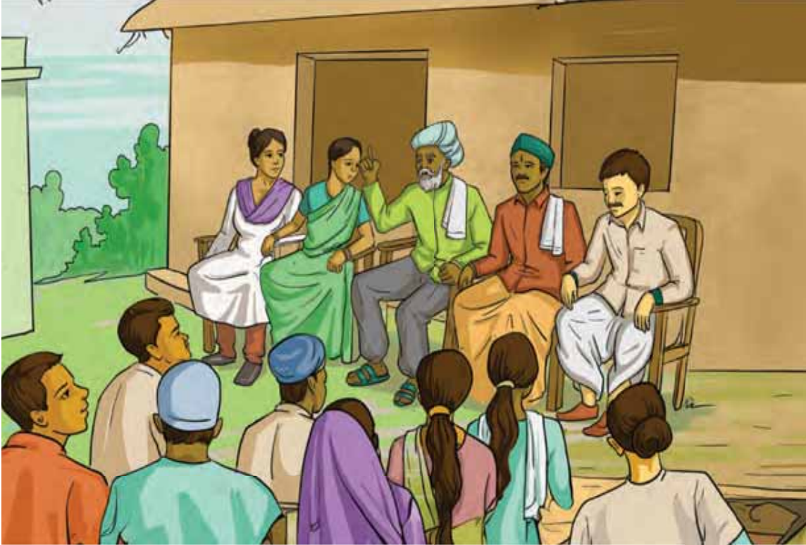
11-મૂળભૂત લોકશાહી - ભાગ 2 : ગ્રામીણ વિસ્તારમાં સ્થાનિક સરકાર

ચાલો, આપણે પાના નં-164 પરના આકૃતિ 11.1ના પાયાના સ્તર ગ્રામપંચાયતથી શરૂઆત કરીએ, જે ગ્રામીણ વિસ્તારોના લોકોની સૌથી નજીક છે. તેના સભ્યો અને સરપંચની ચૂંટણી સીધી ગ્રામસભા દ્વારા કરવામાં આવે છે, જે ગામના (અથવા પડોશી ગામોના જૂથના) પુખ્ત વયના લોકોનું એકજૂથ છે. જેમની મતદાર તરીકે નોંધણી કરવામાં આવે છે. ગ્રામસભામાં, સ્ત્રીઓ અને પુરુષો તેમના વિસ્તારને લગતી બધી બાબતો પર ચર્ચા કરે છે અને નિર્ણયો લે છે. દરેક ગ્રામપંચાયત એક વડા અથવા પ્રમુખને ચૂંટે છે જેને 'સરપંચ' અથવા 'પ્રધાન' કહેવામાં આવે છે. તાજેતરનાં વર્ષોમાં, નોંધપાત્ર સંખ્યામાં મહિલાઓ સરપંચ બની છે.