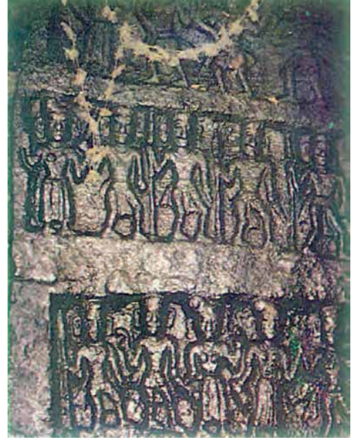
ચિત્ર 8.7 પાંચ પાંડવો

ભીલ, ગોંડ, મુંડા જેવા ભારતના ઘણા બધા અન્ય જનજાતિ સમુદાયોના સંદર્ભમાં આ વાત સાચી છે. ભારતના પૂર્વોત્તર તથા જમ્મુ કશ્મીર સહિતના હિમાલયક્ષેત્રની મોટાભાગની જનજાતિઓ આ બે મહાકાવ્યો માંથી આ બંને મહાકાવ્યોની અથવા કોઈ એકની તેમની પોતાની લોકકથા પણ ઉપલબ્ધ છે. આ જનજાતિ રૂપાંતરણ મૌખિક રૂપે પ્રચલિત થયાં છે. તેની સાથે સાથે દંતકથાઓ પણ ફેલાઈ, જેમાં કોઈ પ્રકારે રામાયણ અને મહાભારતથી જોડાયેલાં પાત્રો (તમામ પાંડવો અથવા તેમાંથી કોઈ એક, તેમની પત્ની દ્રૌપદી, વળી ક્યારેક તેમનો શત્રુ અને પિતરાઈ ભાઈ દુર્યોધન) એ જનજાતિઓના સંબંધિત ક્ષેત્રોમાં વિચર્યા હતા.