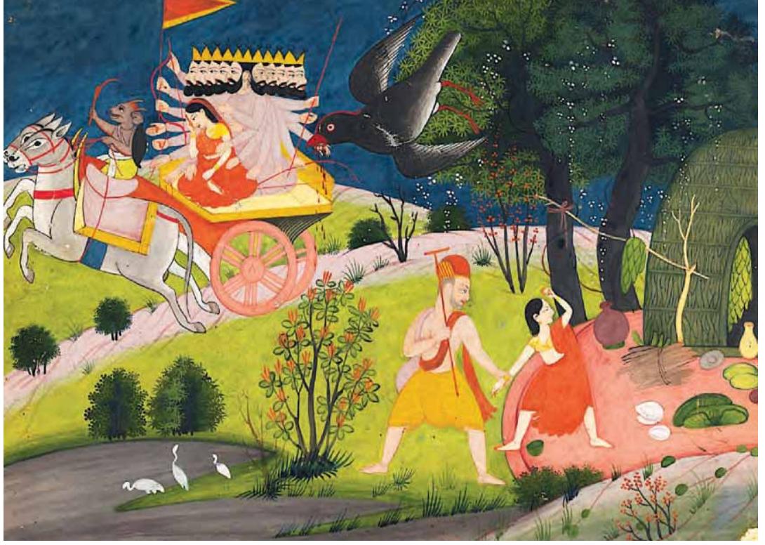
ચિત્ર 8.6 રામાયણની એક મુખ્ય ઘટનાને દર્શાવતું ચિત્ર (18 મી સદી, હિમાચલ પ્રદેશ)