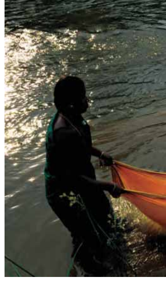
ચિત્ર 8.4 સ્ત્રીઓ સાડીનો પહેરવેશ ઉપરાંત અન્ય ઉપયોગ કરે છે. (દક્ષિણ ભારતનાં ચિત્રો)