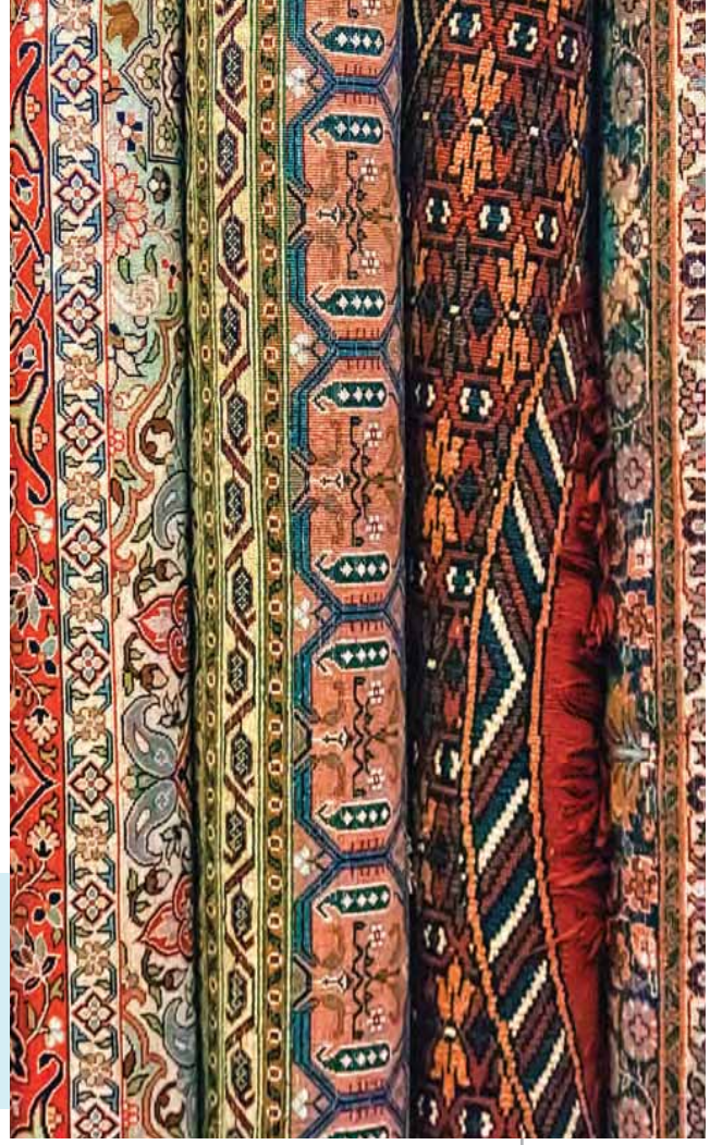
ચિત્ર 8.3 રંગબેરંગી ભારતીય સાડીઓ

સાડીનું ઉદાહરણ એકતા અને વિવિધતા બન્ને કેવી રીતે પ્રતિબિંબિત કરે છે તે (100-150 શબ્દોમાં) સમજાવો.