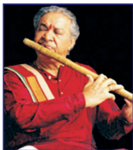
Hari Prasad Chaurasia [ ]