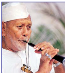
Bismillah khan [ ]