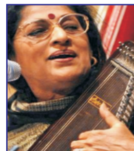
Kishori Amonkar [ 1 ]