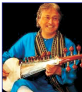
Amjad Ali khan [ ]

1. Match the musicians with the musical skill they are known for. One is done for you.